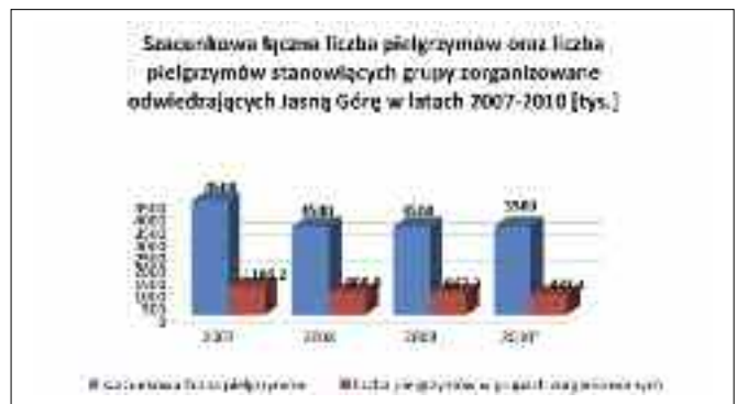
Rys. 1. Pielgrzymi na Jasnej Górze.

Z punktu widzenia zasad logistyki miejskiej istotne znaczenie posiada szerokość strumieni przepływów ludzi. Z tego punktu widzenia ważne jest określenie jaka ilość pielgrzymów przyjeżdża do Częstochowy indywidualnie, a jak w grupach zorganizowanych. Powyższe zależności ilustruje rysunek 1.