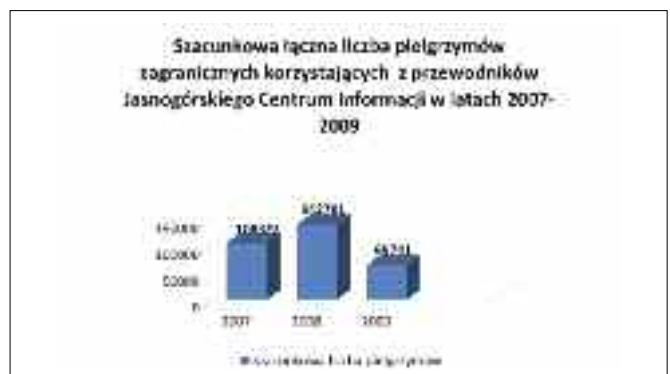
Rys. 2. Pielgrzymi z zagranicy w latach 2007 – 2009.

Według danych Biura Prasowego Jasnej Góry, w latach 2007 – 2010 istotny udział w ruchu pielgrzymkowym posiadają także pielgrzymi zagraniczni. W roku 2007 i 2008 przybyli pątnicy z 81 krajów świata, a w roku 2009 z 83 krajów świata. Statystyka pielgrzymów z zagranicy została przedstawiona na rysunku 2.