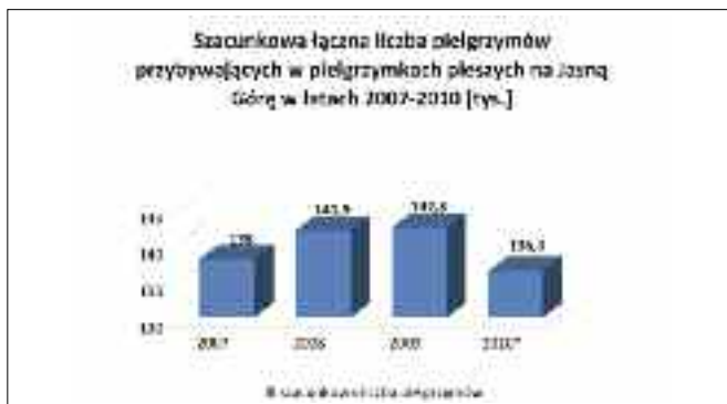
Rys. 3. Liczba pielgrzymów w pielgrzymkach pieszych.

Jak wskazują statystyki, liczba pielgrzymów w pielgrzymkach pieszych od roku 2007 do 2009 rosła, natomiast w roku 2010 przewiduje się, że wystąpi tendencja spadkowa. Ten typ pielgrzymek wymaga od służb zarządzających przepływami w obszarze logistyki miejskiej Częstochowy najdokładniejszego planowania i koordynacji. Jest to spowodowane faktem bardzo dużego wpływu pielgrzymek pieszych na ruch miejski oraz przepustowość ulic, którymi przemieszczają się pątnicy. W celu jak najlepszej koordynacji i uzyskania najmniejszego negatywnego wpływu na ruch miejski, pielgrzymki piesze w obrębie miasta poruszają się po ustalonych, stałych 10 trasach. Trasy te zostały wyznaczone przez Miejski Zarząd Dróg w Częstochowie, na podstawie informacji o wielkości strumieni pątników