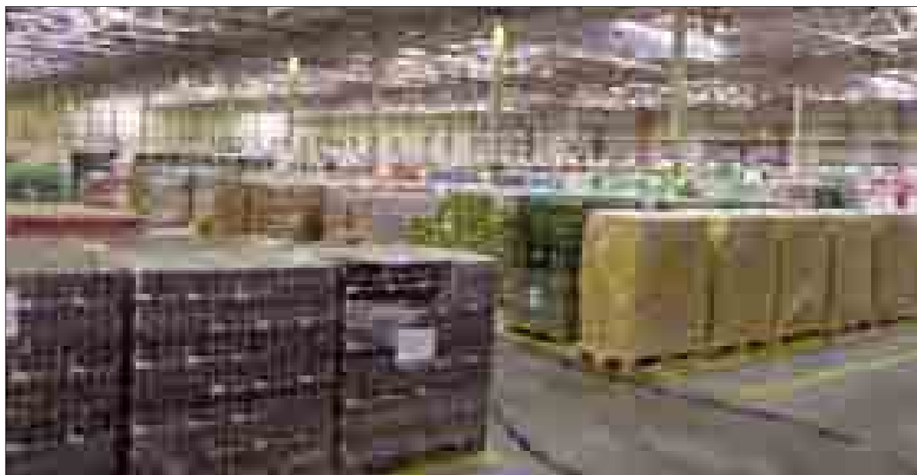
Fragment wnętrza Centrum Dystrybucyjnego