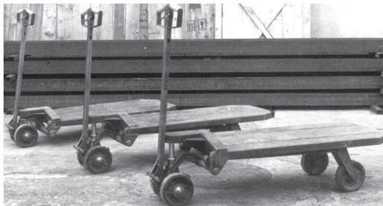
Rys. 6. Wózki jezdniowe ręczne unoszące platformowe (z ang. fork pallet truck ).