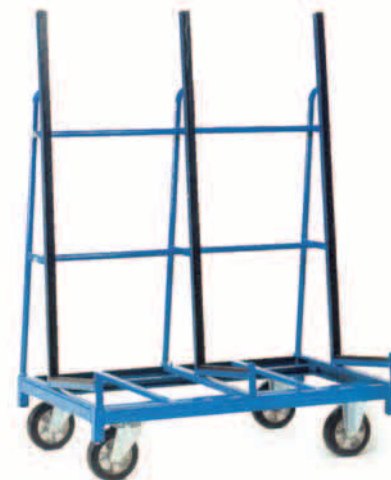
Rys. 4. Wózek jezdniowy ręczny specjalizowany.

• podnośnikowe, w terminologii angielskiej nazywane pedestrian propeller sta-