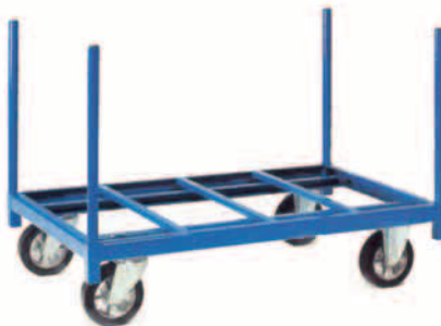
Rys. 3. Wózek jezdniowy ręczny ramowy (z ang. pedestrian propeller frame truck lub hand frame truck ).

- ramowe – z ang. pedestrian propeller frame trucks lub hand frame trucks (rys. 3)