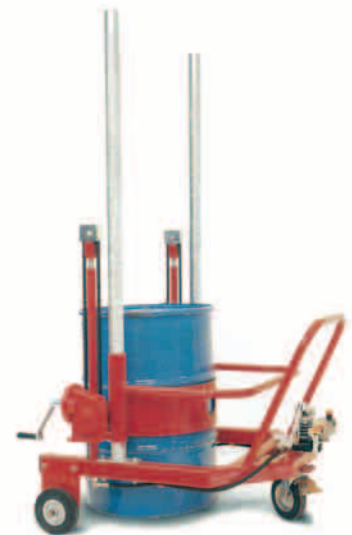
Rys. 13. Wózek jezdniowy ręczny podnośnikowy specjalizowany (z ang. specialized pedestrian propeller stacking truck ).

cking trucks lub hand lift trucks , a wśród nich odmiany wynikające z cech konstrukcyjnych: