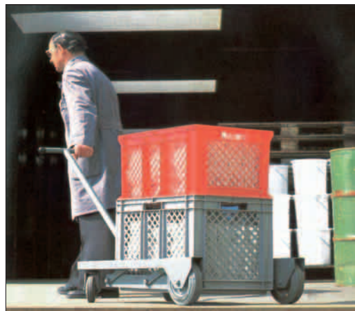
Rys. 10. Wózek jezdniowy ręczny podnośnikowy platformowy (z ang. platform pedestrian propeller stacking truck ).