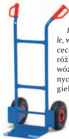
Rys. 1. Wózek jezdniowy ręczny taczkowy (z ang. two-wheeled truck).

• Naładowne, w terminologii angielskiej nazywane pedestrian propeller platform truck