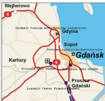
Rys. 2. Planowane centra logistyczne i parki magazynowe w rejonie Trójmiasta. Źródło: opracowanie na podstawie mapki Cushman & Wakefield (2008-12-01).

Gdyńskie Centrum Dystrybucyjno Logistyczne zaplanowano w sąsiedztwie Bałtyckiego Terminalu Kontenerowego, Gdynia Container Terminal oraz Terminalu Promowego obsługującego (między innymi za pomocą dwupoziomowej rampy) połączenie promowe Stena Line z Gdyni do Karlskrony. Usytuowane po zachodniej stronie Estakady Kwiatkowskiego centrum sąsiaduje z Baltic Auto Center (centrum dystrybucji samochodów o zdolności obsługi około 30 000 pojazdów rocznie) oraz licznymi mniejszymi firmami dystrybucyjnymi 15 . Natomiast na północny zachód od centrum, na terenie o powierzchni 7 ha, zbudowane zostało Trefl Logistic Center (TCL) – inwestycja firmy Trefl SA. 1 kwietnia 2008 roku został uruchomiony depot, na którym obecnie składowane jest około 200 kontenerów. Obecnie trwają przygotowania do budowy magazynów o powierzchni 2,5 tys. m 2 16 . Na działalność logistyczną i dystrybucyjną w ramach