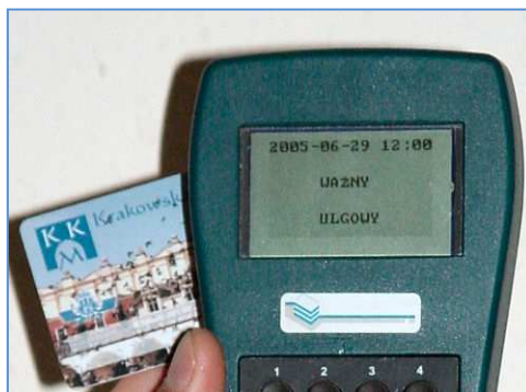
Rys.3. Przenośny czytnik kart miejskich

Technologia RFID może być także bardzo pomocna w zarządzaniu flotą samochodową. Nie chodzi tutaj o funkcje lokalizacyjne, które z powodzeniem spełnia system GPS, ale na przykład o możliwość łatwiejszego korzystania z kart paliwowych. Dzięki zamontowaniu w samochodach firmowych tagów RFID możliwe jest tankowanie pojazdów przez pracowników firmy bez zbędnych formalności. Dzięki zastosowaniu systemu RFID konto firmy zostaje automatycznie obciążone, a kierownictwo ma dostęp do informacji o transakcji zaraz po jej dokonaniu.