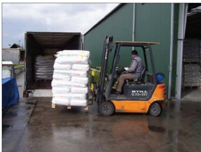
Fot. 2. Załadunek nasion wózkami widłowymi na środek transportu przy wykorzystaniu rampy załadunkowej.

Na podstawie przeprowadzonych badań widać, iż wraz ze wzrostem sprzedaży materiału siewnego następuje wzrost udziału pośredników w dystrybucji materiału siewnego. Jest to szczególnie widoczne w przypadku przedsiębiorstw, których roczna sprzedaż wynosiła powyżej 1 500 ton. Tam udział pośredników w sprzedaży ogółem wynosił 57%. W grupie tych przedsiębiorstw znajdowały się 3 jednostki, które praktycz-