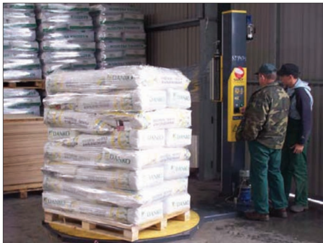
Fot. 1. Przygotowanie nasion do transportu za pomocą owijarki foliowej.

Na podstawie danych zawartych w tabeli 2 można wnioskować, iż w badanych przedsiębiorstwach udział sprzedaży bezpośredniej dominował w jednostkach, gdzie roczna sprzedaż nie przekraczała 1 500 ton nasion. Dominowała w grupie przedsiębiorstw najmniejszych (sprzedaż roczna do 500 ton nasion zbóż) i wynosiła 85%. Udział sprzedaży z wykorzystaniem pośredników wynosił zaledwie 15%. Wysoki udział sprzedaży bezpośredniej wynikał z małej skali produkcji, która wystarczała na pokrycie zapotrzebowania na materiał siewny rolników gospodarujących na terenie działania badanych przedsiębiorstw nasiennych. Sprzedaż bezpośrednia daje możliwość uzyskania wyższej marży handlowej, co sprawia, że mimo niewielkiej skali sprzedaży pozwala osiągnąć godziwy dochód.